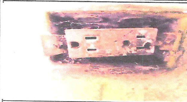
Sistema electrico en pesimo estado.