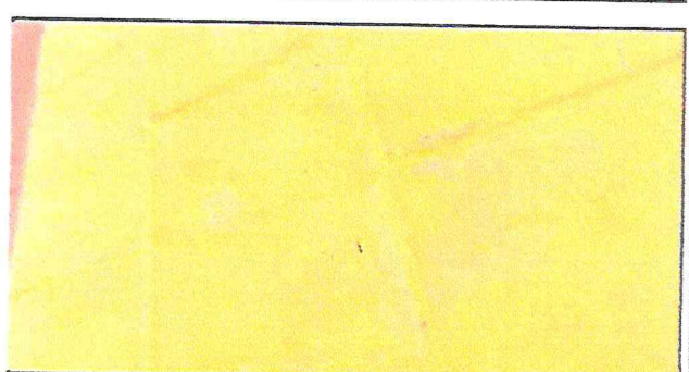
paredes del centro educativo sucias por falta de pintura.

Observación: Si es necesario se pueden agregar hojas adicionales al número de hojas.