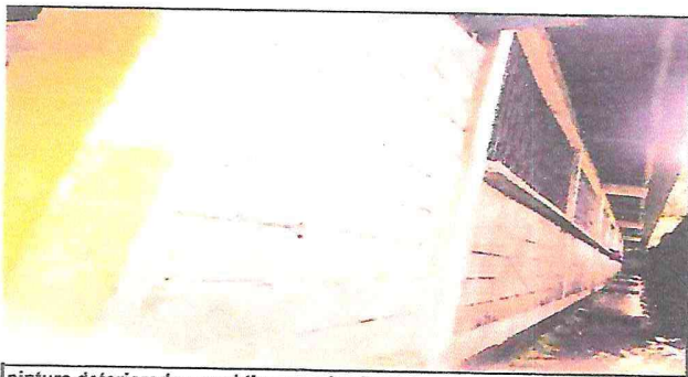
pintura deteriorada por el tiempo y las lluvias